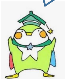
生徒会マスコットキャラ