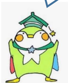
生徒会マスコットキャラ